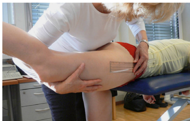
Messung mit drahtlosen Sensoren und mit einem Goniometer. | Mesure au moyen de capteurs sans fil et avec un goniomètre. | Misura con i sensori senza fili e con un goniometro.