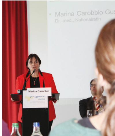
Marina Carobbio ermutigt zum langen Atem und zur Standhaftigkeit. | Marina Carobbio exhorte à la patience et à la fermeté. | Marina Carobbio incoraggia ad essere pazienti e a perseverare.