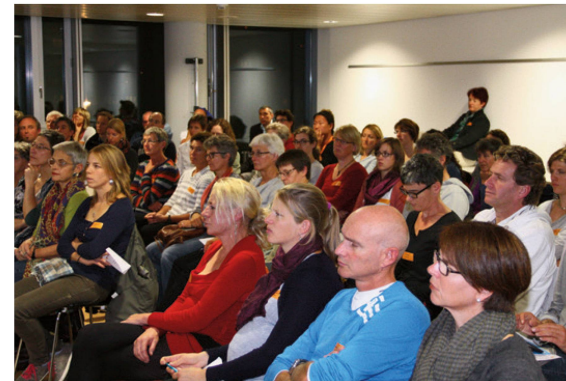
Das aufmerksame Publikum aus Physios und Chiros am gemeinsamen Anlass.

Anschliessend wurde ein Apéro riche in den Eingangsräumlichkeiten des