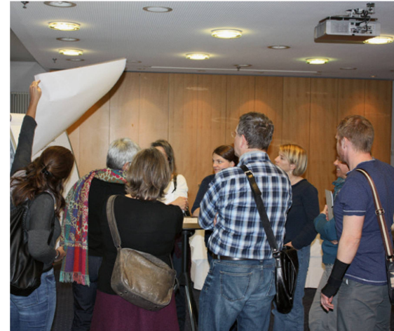
Gebanntes Zuhören – vor der Diskussion. | Écoute attentive avant la discussion. | Ascoltatori attenti – prima della discussione.

aktiver Physiotherapeuten regten die TeilnehmerInnen zu guten Diskussionen an. Neben dem Thema Lobbying wurde noch ein zweiter Workshop zur elektronischen Abrechnung angeboten. Unter dem Titel «EDI – Abrechnung zum Anfassen» konnten sich die Anwesenden zu einer der zentralsten Fragen vieler Selbständigerwerbenden informieren.