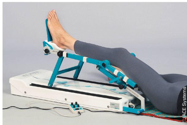
Es bleibt herauszufinden, welche Patienten von einer Bewegungsschiene profitieren. | Il reste à bien identifier quels patients bénéficieront d'une attelle de mobilisation passive.

Eine längerfristige Evaluation zeigt keine signifikanten Veränderungen bei diesen Ergebnissen.