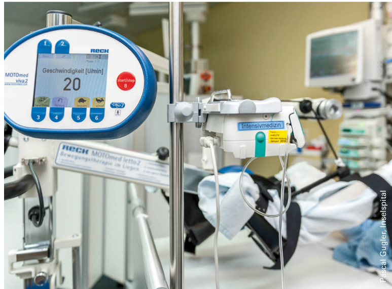
Bettfahradtraining beim beatmeten Patienten. I Entrainement avec vélo de lit pour un patient sous assistance respiratoire.

diese erholten sich nach einem Unterbruch der Therapie jedoch rasch und es kam zu keinen weiteren Schädigungen [8].