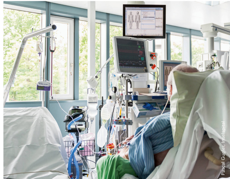
Sitzen im Lehnstuhl auf der Intensivstation. I Position assise dans le fauteuil aux soins intensifs.

marche de 6 minutes, ainsi que la capacité fonctionnelle physique subjective mesurée par le SF-36 1 à la sortie de l'hôpital [12]. En comparaison avec le traitement habituel, la combinaison cessation de l'administration de sédatifs plus mobilisation précoce, comportant de la physiothérapie et de l'ergothérapie, a raccourci de manière significative le nombre de jours sous ventilation ainsi que la période de délire. Grâce à cela, les patients étaient nettement plus autonomes dans leurs activités quotidiennes après leur départ de l'hôpital et ont pu être directement envoyés chez eux au lieu de devoir passer par un centre de réadaptation [13].