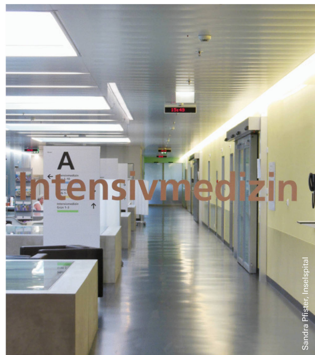
Sandra Pfister, InseSpital

Die Entstehung einer ICUAW wird einerseits durch die kritische Erkrankung begünstigt, wobei Mechanismen wie Hypoxie, Hypotonie, Entzündung, Glukose-Dysregulation, Katabolismus und Mangelernährung eine wichtige Rolle ein-