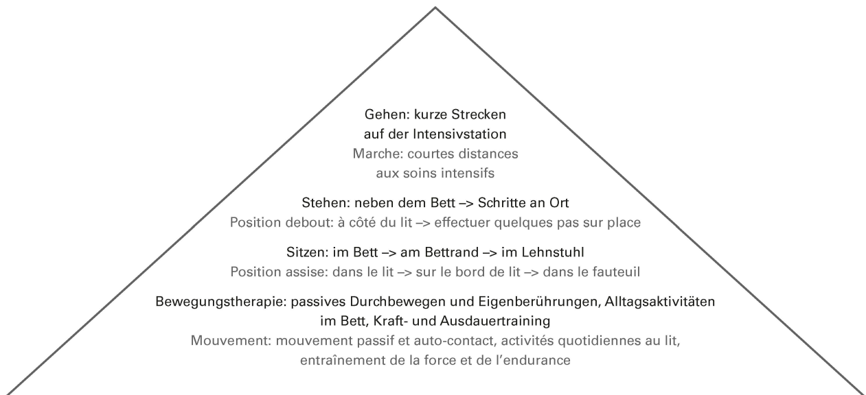
Abbildung 2: Frühmobilisationspyramide mit sukzessiv aufeinander aufbauenden Interventionen. | Illustration 2: Pyramide de la mobilisation précoce avec des interventions successives hiérarchisées.

Anschließend wird die Mobilisationsmethode und -intensität festgelegt. Die Frühmobilisation findet darauf unter einer kontinuierlichen Überwachung hämodynamischer und respiratorischer Parameter statt. Dadurch kann – falls nötig – sofort eingegriffen werden, indem beispielsweise die Intensität reduziert, zusätzlich Sauerstoff gegeben oder die Druckunterstützung des Beatmungsgerätes erhöht wird [9].