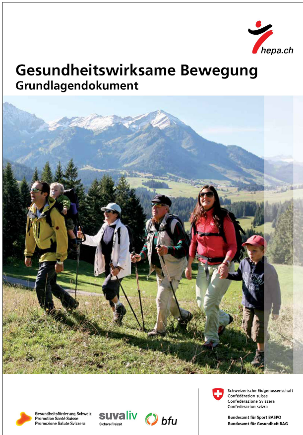
Abbildung 1: Die 2013 erschienene neue Ausgabe des Schweizer Grundlegendokuments gesundheitswirksame Bewegung enthält unter anderem eine Aufzählung der Gesundheitseffekte regelmässiger Bewegung, die aktuellen nationalen Bewegungsempfehlungen für verschiedene Altersgruppen sowie einen Überblick über wirksame Ansätze der Bewegungsförderung ( www.hepa.ch ). I

Figure 1: «Activité physique et santé. Document de base»: La nouvelle version parue en 2013 du document thématique dédié à l'activité physique, garante de la bonne santé de la population suisse, contient notamment un inventaire des effets bénéfiques exercés sur la santé par une activité physique régulière, les plus récentes recommandations à l'échelle nationale en matière de activité physique s'adressant aux différentes tranches d'âges, ainsi qu'une liste des initiatives ayant démontré leur efficacité à promouvoir l'activité physique ( www.hepa.ch ).