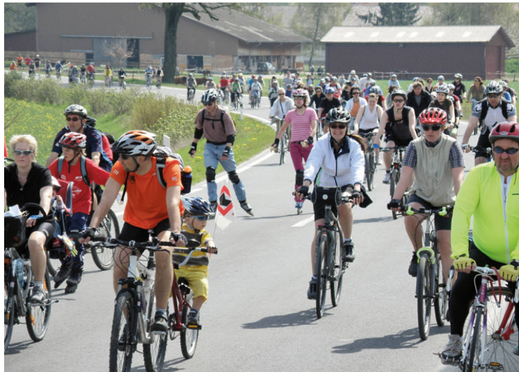
Wie kann nur erreicht werden, dass die Menschen mehr zu Fuss gehen oder Velo fahren? Bild: Ein SlowUp-Event. I Comment faire en sorte que les personnes se déplacent davantage à pied ou à vélo? Image: Un événement SlowUp.

Der Austausch erwies sich als sehr fruchtbar. Bei der Grafik fand die Dosis-/Wirkungsgrafik mit Piktogrammen die meiste Unterstützung anstelle der Pyramidenform, zumindest für die Erwachsenen. Jugendliche scheinen die Scheibe zu bevorzugen. Die Empfehlungen werden nun nochmals überarbeitet und mit diversen Organisationen besprochen. Ob als Scheibe, Pyramide oder Kurve – die neuen Bewegungsempfehlungen werden kommen. ■