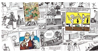
Collage aus dem Comic physio