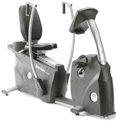
SportsArt FITNESS Krafttrainingsgeräte