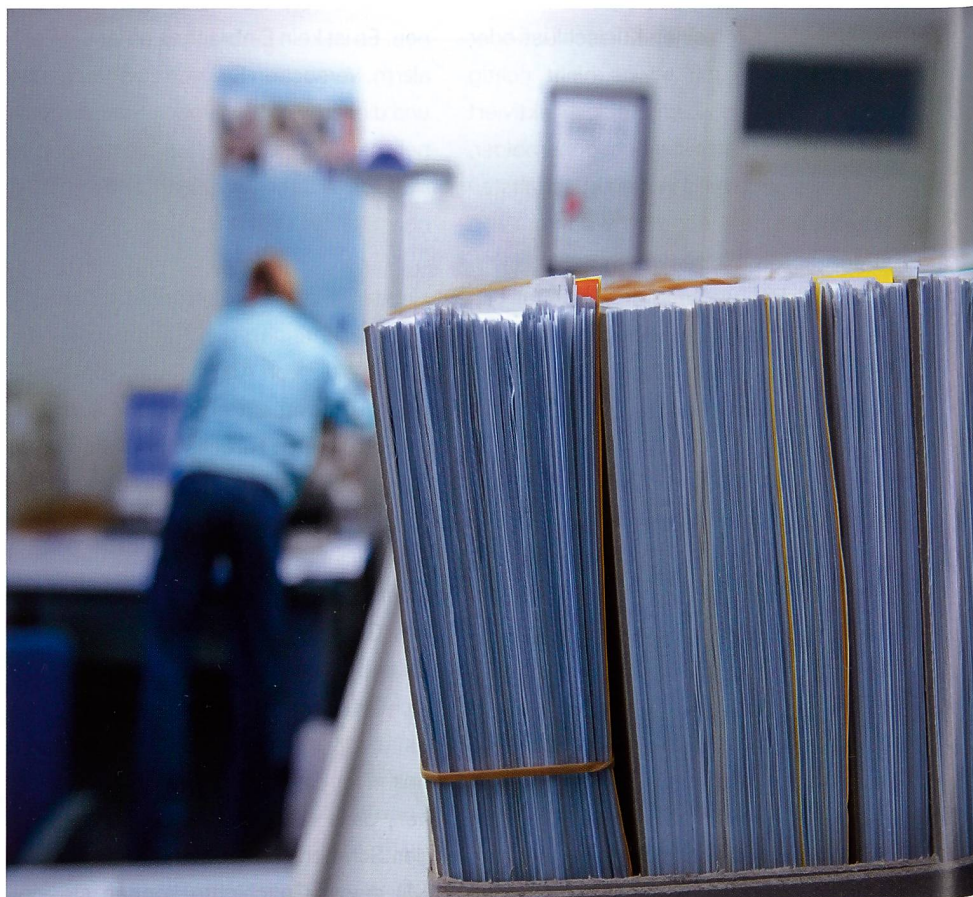
Bei den Physiotherapeuten nehmen die Dossiers unbezahlter Rechnungen zu.

Was können Sie als selbständig erwerbende Physiotherapeutinnen und Physiotherapeuten unternehmen? Sprechen Sie Ihre Patienten auf das Problem an! Falls die Prämienausstände und allfällige Schulden durch den Patienten oder allenfalls durch die Sozialbehörde bezahlt wurden, insistieren Sie bei der Krankenversicherung, dass diese die Kosten der Behandlung übernimmt. Falls Ihnen die Bezahlung weiterhin verweigert wird, leiten Sie den Fall an die Paritätische Vertrauenskommission weiter.