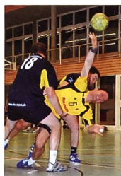
«Schmerz beim Sport»