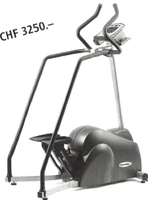
SportsArt FITNESS Stepper S7100