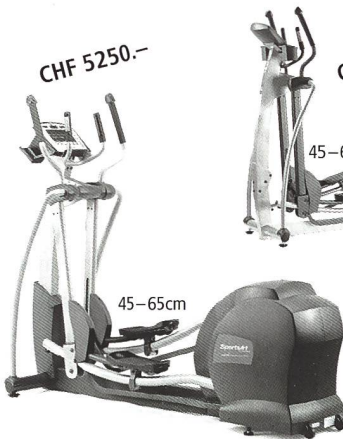
SportsArt FITNESS Elliptical E8300/E82