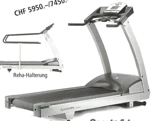
SportsArt FITNESS Laufband 6310/6320