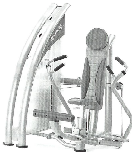
SportsArt FITNESS Krafttrainingsgeräte