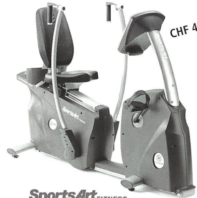
SportsArt FITNESS Crosstrainer XT20