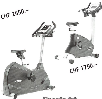
SportsArt FITNESS Ergometer C5200U/53U