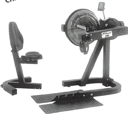
FIRST DEGREE UBE Upper Body Ergometer