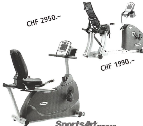
SportsArt FITNESS Liegeergometer C5150R/53R