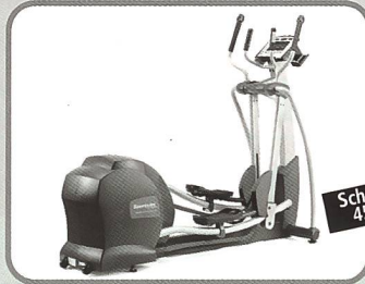
Elliptical mit verstellbarer Schrittlänge