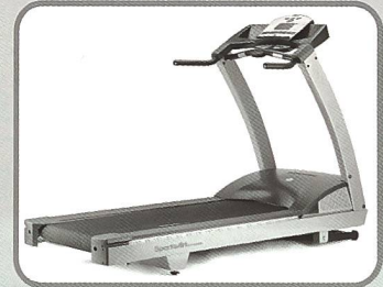
Laufband mit Reversefunktion