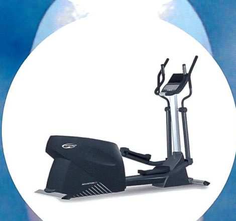
NEU: Hi-Power Cardio-Linie «500Line».