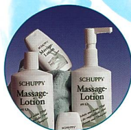
Produkte und Verbrauchsmaterial