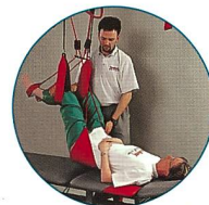
Sling Exercise Therapy

Verlangen Sie unseren Gratis-Gesamtkatalog!