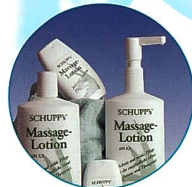
Produkte und Verbrauchsmaterial