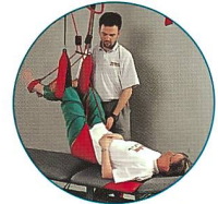
Sling Exercise Therapy

Verlangen Sie unseren Gratis-Gesamtkatalog!