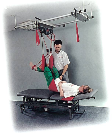
Die dritte Hand des Therapeuten