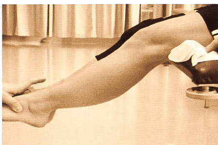
Figure 3: Amélioration de la proprioception par l'utilisation d'une genouillère élastique.

Elle permet un développement du potentiel neuromusculaire et, sans être une finalité, constitue néanmoins une étape souvent obligatoire [48]. Elle doit être adaptée à la technique thérapeutique retenue, à l'objectif moteur du patient et aux délais de cicatrisation.