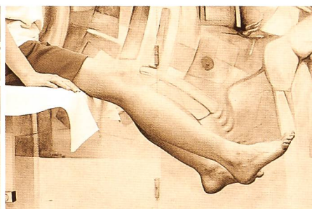
Figure 4: Noter la différence de position articulaire entre les deux genoux (par contrôle de hauteur des deux talons).