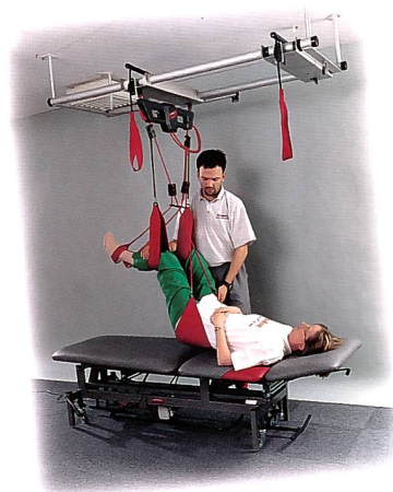
Die dritte Hand des Therapeuten