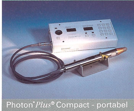
Photon*Plus® Compact - portabel