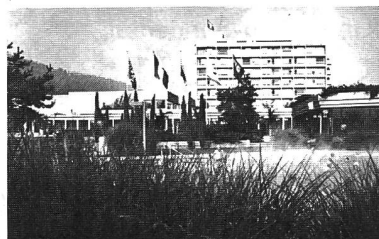
RHEUMA- KLINIK ZURZACH