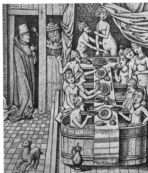
Ill. 10: Bain dans la haute bourgeoisie. Miniature extraite d'un manuscrit illustré pour Antoine de Bourgogne, 2ème moitié du 15ème siècle. (L'empereur est spectateur et un ecclésiastique applaudit à la scène!)