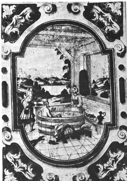
Ill. 7: Wolfenschiessen est assassiné au bain par Baumgartner furibond, parce qu'il avait voulu déshonorer la femme de celui-ci. Vitrail de 16ème siècle.

(Les illustrations sont extraites de la collection intitulée «La physiothérapie à travers l'histoire et l'art», appartenant aux sociétés Fango Co. GmbH, 8640 Rapperswil, et Physio-Service SA, 1023 Crissier)