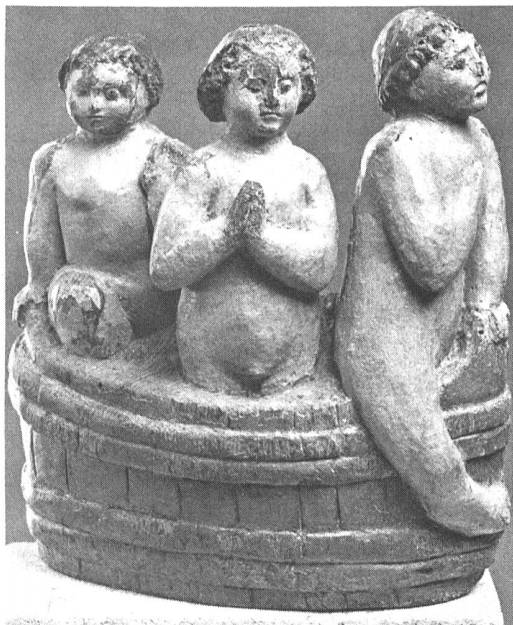
Ill. 11: Sculpture de bois accompagnant une statue de saint, vers 1500: trois pieuses filles au bain.