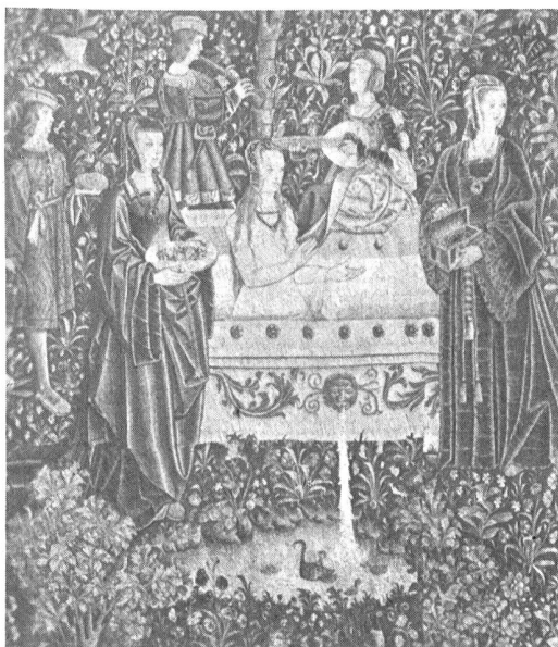
Ill. 12: «La vie seigneuriale: le bain». Gobelin de style «mille fleurs», originaire de Hollande du Sud, fin du 15ème siècle.