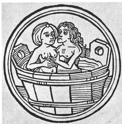
Ill. 8: Feuille extraite du Calendrier Allemand, 1495.