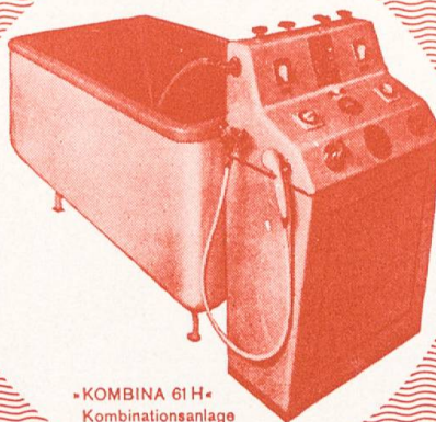
»KOMBINA 61 H« Kombinationsanlage