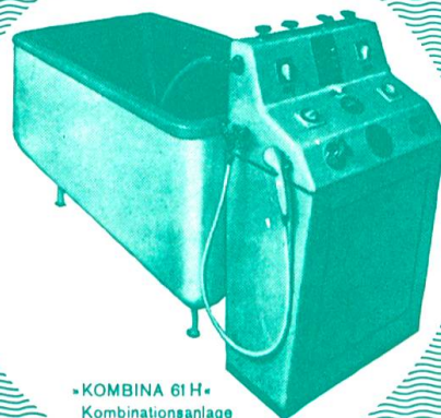
» KOMBINA 61 H « Kombinationsanlage