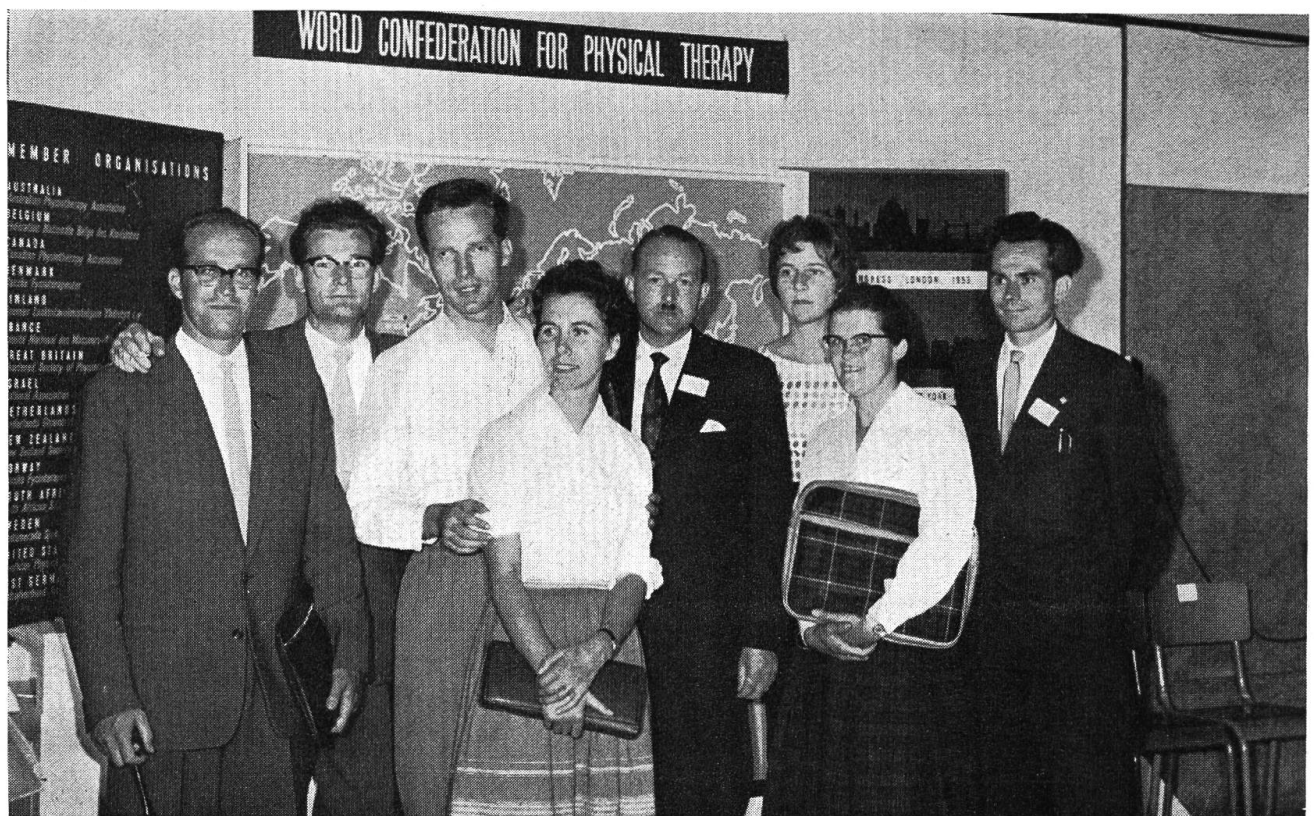
Teilnehmer am Kongress in Paris