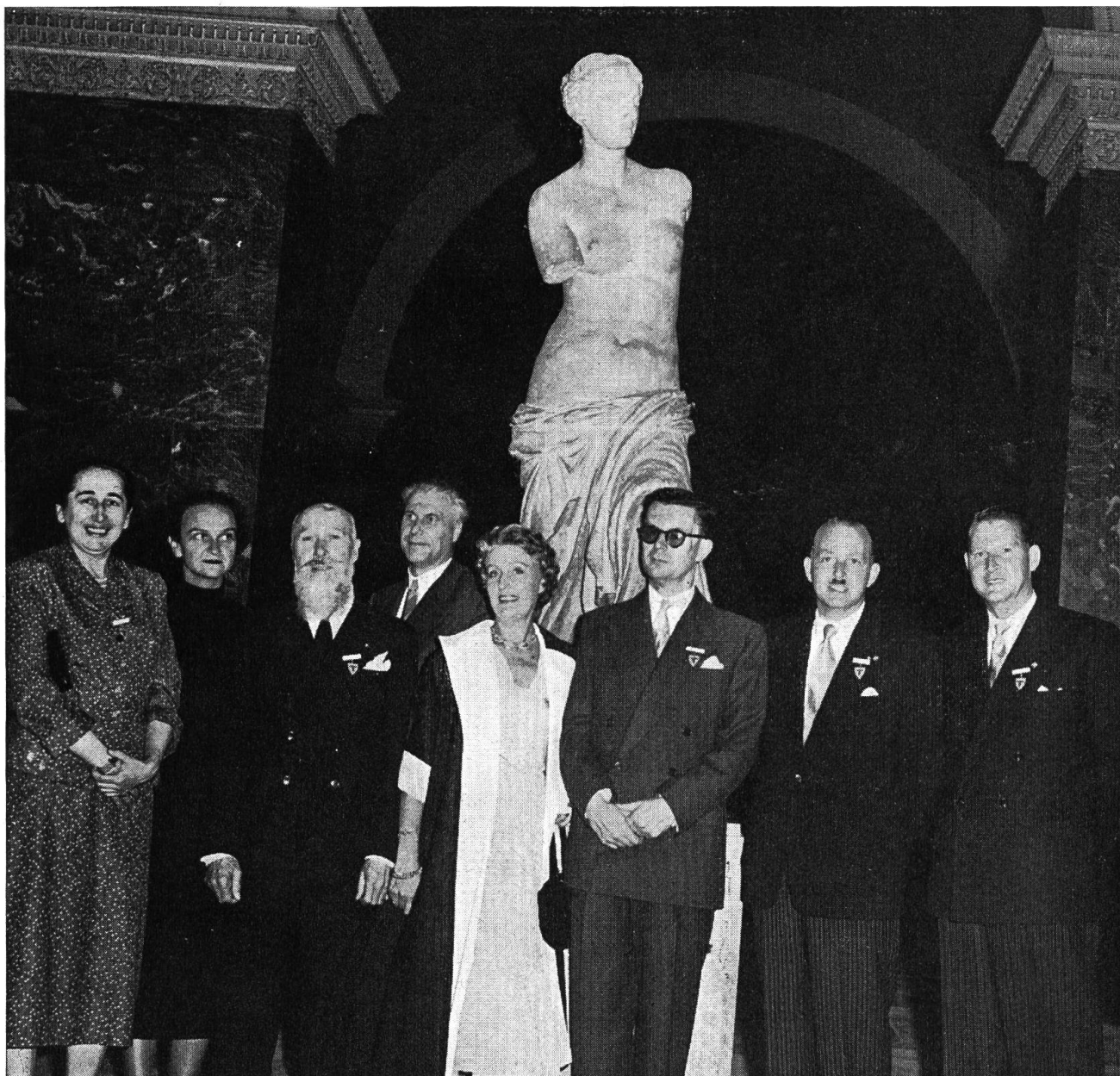
Ein Teil des «Europäischen Vorstandes» anlässlich einer Sitzung, im Louvre, Paris

Blutauffrischung verlangen. Wir «Jungen» nun mittelalterlich, suchen wieder genügend Initiative, Begeisterungsfähige, Frischgebakene, um die Kontinuität des Verbandes zu gewährleisten, um neue Erfordernisse zu bewältigen. Erst die Einsichten in die Details zeigen auf, was alles getan wurde und noch zu tun ist. Wir sind auch sehr dankbar für das Viele, was schon erreicht wurde, ohne Aufsehen. Wir zählen auf die jungen Kolleginnen und Kollegen, die durch die Teilnahme am Verbandsgeschehen viel Wertvolles für sich persönlich und für den Beruf gewinnen können und damit das hohe Erbe früh genug schätzen lernen.