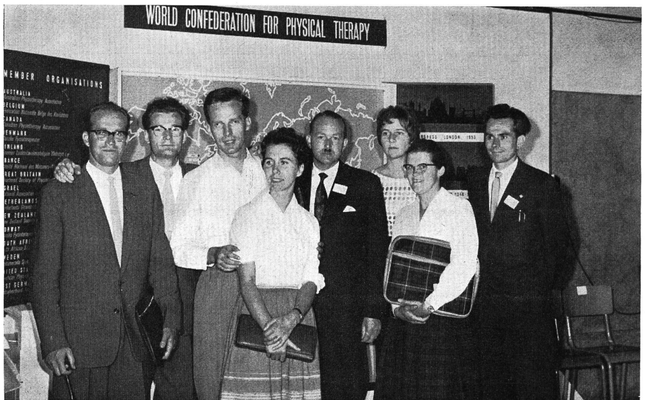
Teilnehmer am Kongress in Paris