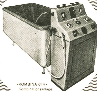
»KOMBINA 61 H« Kombinationsanlage

Redaktion: Für den deutschen Teil: Oskar Bosshard, Tödistrasse 53, 8800 Thalwil Administration und Expedition: Schweiz. Physiotherapeuten-Verband Thalwil Inseratenteil: Plüss Druck AG, Postfach 299, 8036 Zürich, Tel. 051 / 23 64 34