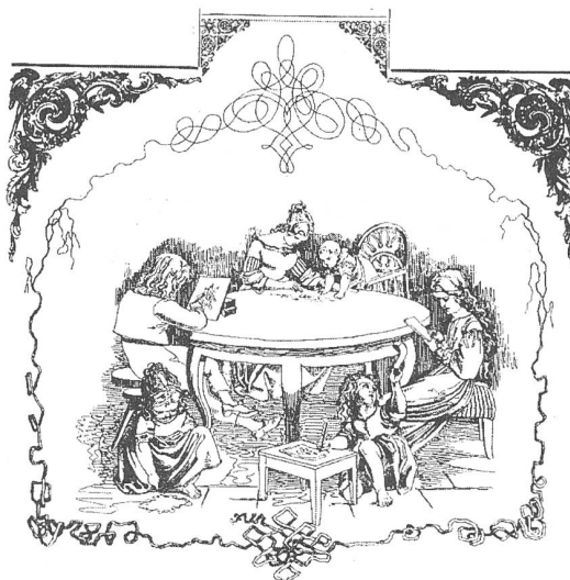
Harmonische Selbsttätigkeit in der Wohnstube Aus: Fröbel/Pfaehler 1982

Deutlich ist aber von Schulbildung die Rede, die "études publiques" (La Chalotais 1996, S. 36) sollten erneuerten Schulen anvertraut werden, ohne länger ei-