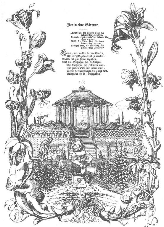
Das natürliche Kind. Aus: Fröbel/Pfaehler 1982

Natur ist Schöpfung , letztlich ideelle Schöpfung, anders wäre sie nicht "divin". Wer damit im Widerspruch steht, kann nur das finale Unglück erleben, eben das macht die Arroganz des Bösen aus. Die richtige Erziehung 3 legt die Grundlage für Tugend und Glück, sofern sie im Einklang mit der Natur steht. Die natürliche Erziehung ist die des Hauses , und im Haus mehrheitlich der Mutter und nicht des Vaters 4 . Im juste milieu der Familie (S. 378) lernen Kinder unaufhörlich (S. 374), vorausgesetzt ihre "curiosité naturelle" (S. 375) und "une petite vanité naissante" (ebd.). Kinder lernen spielend (S. 375f.), unterstützt von der "tendresse" der Mütter, soweit diese nicht hypokritisch wird 5 . Kinder beobachten die Fehler der Erwachsenen (S. 380), sie unterwerfen sich dem Gesetz, aber registrieren sehr ge-