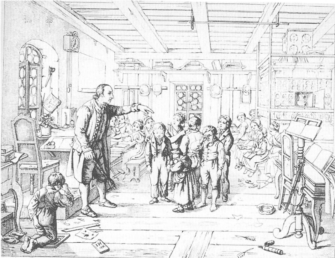
„Vollständige harmonische Entwicklung aller Anlagen eines Menschen?“ Aus: Schiffler/Winkeler 1991

Das ist so etwas wie die Doktrin der „Menschen-erziehung“. Grundlegend ist die Aktivität des „empfindsamen Wesens“, das nicht passiv lernen kann. Seine Unterscheidungsfähigkeit muss je proportional zu seinen Kräften verstanden werden. Erst wenn ein Überschuss an Kräften vorhanden ist, der für den unmittelbaren Lebensunterhalt nicht gebraucht wird, entwickelt das aktive Wesen spekulative Fähigkeiten, die den Kräfteüberschuss (und nur ihn) in eine Richtung lenken kann, die die unmittelbare Situation übersteigt. Wer also die Intelligenz entwickeln will, muss die Kräfte kultivieren, die sie lenken sollen. Die Intelligenz lenkt sich nicht selbst, sie ist eine Funktion der Natur und entwickelt sich mit ihr. Geist entsteht nicht aus sich selbst, sondern bedarf der Unterstützung und Absicherung der Natur.