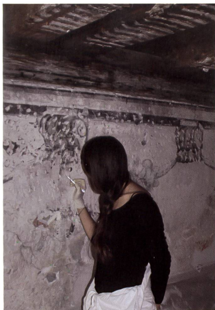
Fig. 160 Work in progress : retouches et consolidations de l'enduit et du décor de 1711-1712 après dégagement et avant compléments.