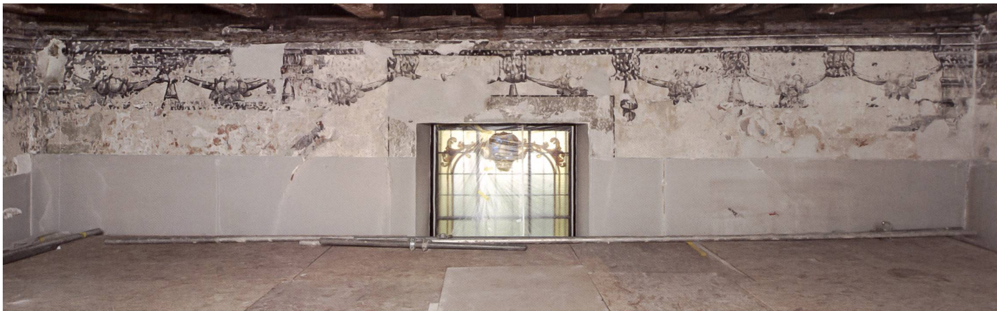
Fig. 106 Le mur sud, après dégagement du décor de consoles et de guirlandes agrémentées par des bouquets de fruits, limités par des pilastres toscans dans les angles, juillet 2015.

vision d'ensemble des dégradations d'un immeuble et déterminer le coût estimatif des investissements nécessaires sur la base d'une approche normalisée et codifiée. Ainsi la méthode MERIP divise un bâtiment en 50 éléments standards dont il est possible d'évaluer en quelques heures l'état et le coût d'entretien.