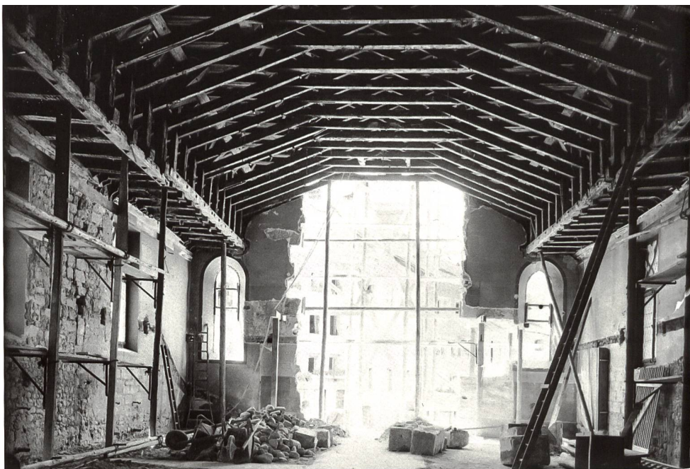
Fig. 167 Rénovation de la nef de l'église Saint-Jean en 1951, après démolition de la tribune et de la galerie des prisonniers dont on distingue encore tout à droite la porte d'accès, liant autrefois l'église à l'hospice et à la commanderie.