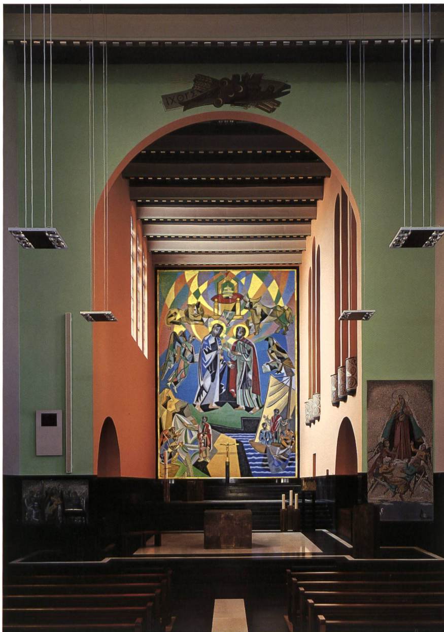
Fig. 151 Le chœur de Saint-Pierre, avec le lieu de prière réaménagé et paroi-retable en mosaïque de Gino Severini, état en 2006.

MOBILIER LITURGIQUE Hafis BERTSCHINGER, Fribourg et Fonderie RÜETSCHI AG, Aarau