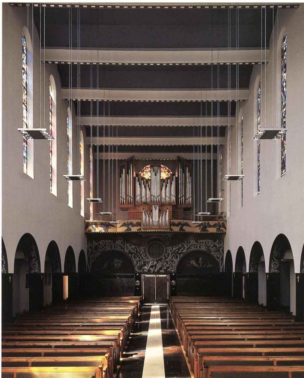
Fig. 148 La nef, avec polychromie reconstituée, de Gino Severini, motifs ornementaux nettoyés, bancs dotés de coussins et perspective des suspensions, état en 2006.

consiste en la mise en place d'un profil situé au plafond derrière l'arc triomphal, dans une position invisible de l'assemblée, où est installée une batterie de projecteurs dotés d'optique cor-