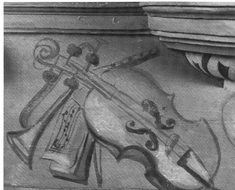
Abb. 7-8 Freiburg, Klosterkirche Magerau; Musikinstrumenten-Bouquets auf dem Basisgesims des Haupt-gehäuses: Trompete, Flöte und Viola da Gamba (links) sowie Laute und Zinken (rechts unter der Konsole des Mittelturms). – Fribourg, église de la Maigrauge; trophées d'instruments de musique au pied de la tourelle du buffet principal: à gauche, trompette, flûte et viole de gambe; à droite, luth et cornets à bouquin.