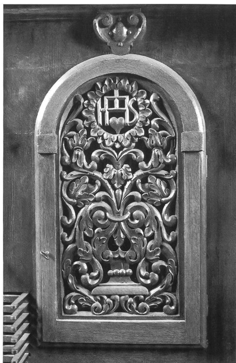
Abb. 15 Freiburg, Kathedrale, Chororgel; je ein Türchen mit durchbrochenem frühbarockem Schnitzwerk ist dem Brustwerk vorgeblendet. – Fribourg, cathédrale, orgue de chœur; l'un des deux guichets ajourés, permettant la diffusion du son du positif pectoral.