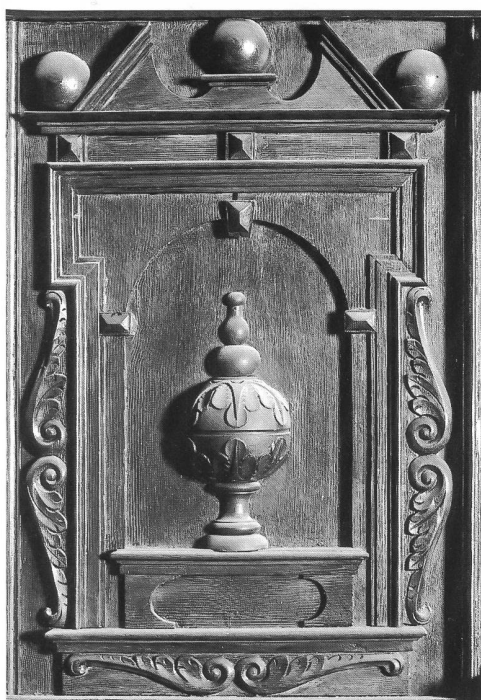
Abb. 14 Freiburg, Kathedrale; Panneau der Empore der Chororgel. – Fribourg, cathédrale; détail de la tribune de l'orgue de chœur.