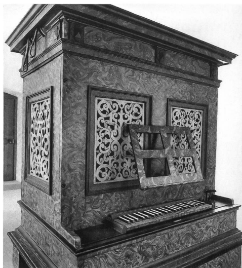
Abb. 4 Freiburg, Bürgerspitalskapelle, Pedalpositiv; Front mit durchbrochenen Schnitzereien. – Fribourg, chapelle de l'Hôpital des Bourgeois, positif à pédale.

Sieht man vom Gehäuse und den Schleierbrettern der Chororgel von Estavayer-le-Lac und eventuell der bekrönenden Mittelturm-Konsole von St. Antoni ab – die zwar nicht unbedingt von einer Orgel, sondern auch von einem anderen «Ausstattungsgegenstand» stammen könnten –, so kann sich der Kanton Freiburg nur eines einzigen vor 1650 zu datierenden Gehäuses brüsten: des Hauptgehäuses der in der Kirche der Zisterzienserinnen der Magerau (Maigrange) bei Freiburg stehenden Orgel 11 (Abb. 9). Aus der Jahresabrechnung 1648/49 dieses Klosters geht hervor, dass die Schwestern zu jener Zeit ein Instrument für 2400 Pfund hatten erstellen lassen; zu Beginn des 19. Jahrhunderts – in der Jahresrechnung von 1806/07 ist von einer «Réparation de L'Orgue» die Rede 12 – wurde das Instrument durch Aloys Mooser umgebaut, wie heute noch erhaltenes Pfeifenwerk dieses Meisters bestätigt. 1881 liessen sich die Schwestern durch den damals in Freiburg ansässigen Orgelbauer Ludwig Mauracher zum Abschluss eines Vertrags für den Bau eines neuen zweimanualigen Instruments mit neugotischem Gehäuse 13 und zum Abtreten der bestehenden Orgel überrumpeln, die der genannte Orgel-