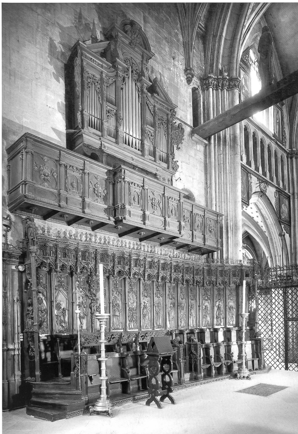
Abb. 12 Freiburg, Kathedrale; die eindrückliche Situation der Epistelseite im Chor mit dem spätgotischen Chorgestühl und der frühbarocken Empore mit der Orgel Sebald Manderscheidts von 1654/57. Laut Vertrag war lediglich ein einmanualiges Werk mit Pedal vorgesehen, das während der Bauzeit um eine Cop(p)el – hinter den Prospekt Pfeifen der Fiffera (in den oberen Mittelfeldern) – und einem auf der Abb. nicht sichtbaren Brustpositiv von 6 Registern erweitert wurde. 1998 Wiederherstellung des ursprünglichen Zustands durch Orgelbau Kuhn, Männedorf. – Fribourg, cathédrale. L'orgue de chœur de Sebald Manderscheidt de 1654/57, avec sa tribune contemporaine baroque, suspendue au-dessus des stalles gothiques tardives. D'après le contrat, on prévoyait un instrument à un seul clavier et pédale, mais finalement on ajouta un Bourdon 8' derrière les tuyaux de la Fiffera (plates-faces supérieures) et un positif pectoral de 6 jeux (invisible sur la photo). Reconstitution de l'état original par la Maison Kuhn en 1998.