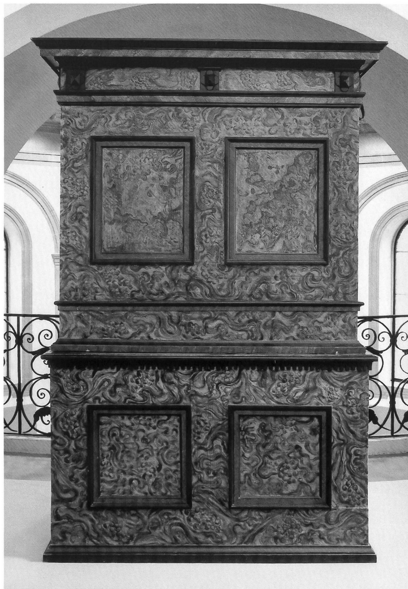
Abb. 3 Freiburg, ehem. Bürgerspitalskapelle; Pedalpositiv von Sebald Manderscheidt um 1667, seinerzeit hinter dem Hauptaltar der Freiburger Spitalkirche zu Liebfrauen aufgestellt. Ansicht des Gehäuses von hinten mit z.T. noch originaler, 1982 durch B. Engler, Untereggen (SG), restaurierter maserholzartiger Fassung. – Fribourg, chapelle de l'ancien Hôpital des Bourgeois; positif à pédale de Sebald Manderscheidt vers 1667, à l'origine placé derrière le maître-autel de l'église Notre-Dame de Fribourg. Vue de l'arrière du buffet, montrant la peinture en faux bois restaurée par B. Engler.

Sensebezirk bekrönt (Abb. 68), einen Bezug zu Alpnach, dem Wohn- und Arbeitsort Schönenbühls – wenn nicht gar zu diesem Orgelbauer selbst – haben könnte. Unter diesen Verzierungen reicht zumindest die schmucke Konsole über dem Mittelturm ins 17. Jahrhundert zurück (wenngleich die gewiss aus späterer Zeit stammenden Musikinstrumenten-«Bouquets» über den Aussentürmen sowie der eigentliche Blumenstrauß über der genannten Konsole a priori mehr das Augenmerk auf sich lenken) 9 ; in der Tat hatte der Heitenrieder Pfarrer Franz Xaver