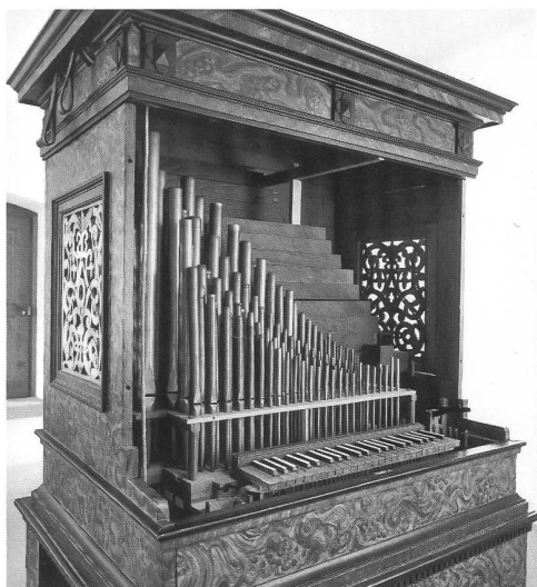
Abb. 5 Das Pedalpositiv nach Entfernung der Vorderfront. – La face antérieure du buffet sans l'élément amovible.

Geheiss der Denkmalpflege die Säule mit dem Wappen der Äbtissin Anne Techtermann aus dem Jahre «1610», die den bis anhin erhöhten Schwesternchor gestützt hatte, im neuen Raumkonzept irgendwo Verwendung finden sollte, weshalb sie zum Trägerelement der neu zu errichtenden Orgelempore bestimmt wurde 18 . Trotz der minutiösen Untersuchung des alten Gehäuses konnte kein Hinweis auf den ursprünglichen Erbauer gefunden werden; eine erst kurz vor der Einweihung durch den Orgelbauer getätigte Öffnung in der originalen Mit-