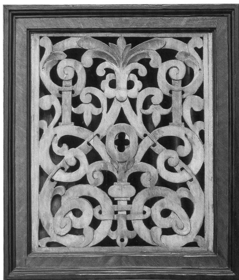
Abb. 6 Freiburg, Bürgerspitalskapelle, Pedalpositiv; Panneau mit durchbrochener Schnitzerei. – Fribourg, chapelle de l'ancien Hôpital des Bourgeois, positif à pédale. Panneau ajouré de tradition maniériste.

telturmdecke führte zur Entdeckung einer verborgenen Inschrift, auf der leider mit Sicherheit nur noch der Vor(?) -Name «Christofel» und die Jahrzahl «1648» entziffert werden konnten, weil ein durch das Bekrönen des Mittelturms mittels einer den Hl. Geist darstellenden Taube getriebenes Loch genau an dieser Stelle die integrale Lesung des Nach(?) -Namens des Autors dieser Aufschrift verunmöglicht 19 .