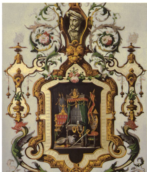
Fig. 5 Détail d'un panneau intermédiaire avec les attributs d'Henri II.

En effet, au moment de la pose, le colleur doit se livrer à toute une série de savants découpages pour faire en sorte que les différents éléments se combinent entre eux élégamment, tout en tenant compte de la spécificité des lieux. Dans le cas présent, les adaptations sont particulièrement sensibles au niveau de la bordure haute, constituée d'arcs à six lobes complétés par des bouquets de fleurs sur un cordon. Or, au-dessus de la porte du placard et du poêle, certains arcs ont été agrandis par le collage d'un lobe supplémentaire ou au contraire rétrécis d'un élément, pour mieux s'adapter à la largeur donnée. De même, les bouquets de