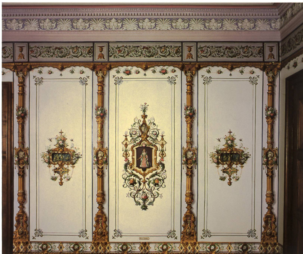
Fig. 4 Vue de la paroi à gauche de l'entrée: panneau principal avec Diane de Poitiers, entouré de deux «intermédiaires», de «pilastres» et de bordures supérieures et inférieures.

vraison comporte deux rouleaux de «décor» (les panneaux), normalement livrés avec quatre motifs différents 11 contre un rouleau d'intermédiaires, avec quatre motifs «variés». Les seize montants forment quatre rouleaux et sont complétés par des «dessus de montants» et des «vases» destinés à faire la liaison avec la bordure haute et la frise; par contre, vu la hauteur qui correspondait parfaitement à celle du montant (7 pieds, 10 pouces soit 2,58 m), il n'a pas été