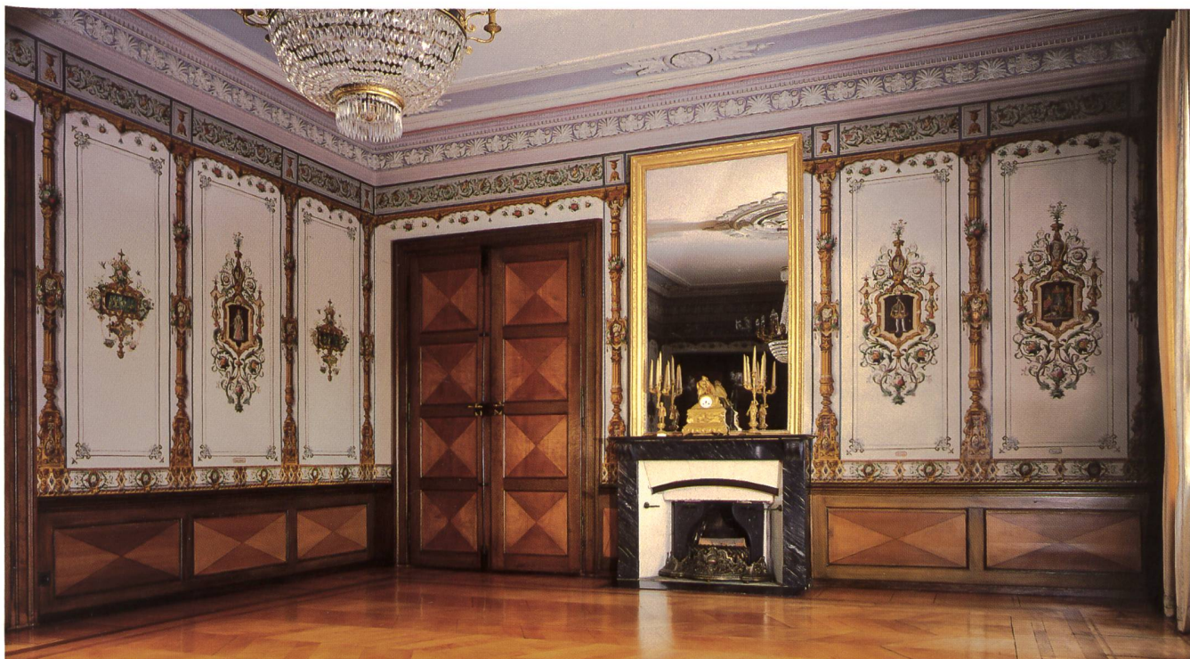
Fig. 2 Vue générale du salon d'apparat avec son «Décor historique Style Renaissance».

tardif, avec une grande rosace centrale à motifs de rinceaux, palmettes et visages d'enfants.