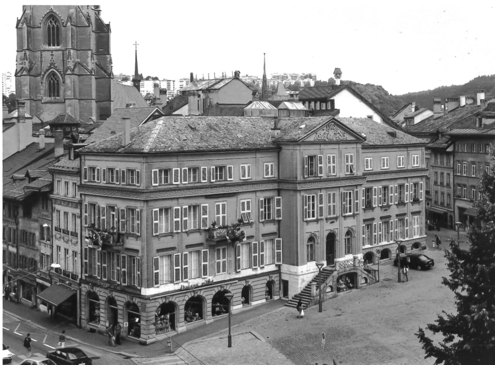
Fig. 1 La maison d'Alt sur la place de l'Hôtel-de-Ville à Fribourg.

Très peu de ces décors de papier peint sont parvenus jusqu'à nous, ce qui fait tout l'intérêt de celui qui est conservé dans la maison d'Alt à Fribourg 3 . En effet, les papiers peints sont par nature éphémères, plus particulièrement encore en milieu urbain, où les maisons, habitées en principe toute l'année, souffrent plus souvent de changement de décor que les résidences campagnardes estivales. Si l'ancienne salle à manger et le petit salon n'existent plus, suite à d'importantes transformations intervenues dans l'immeuble, en revanche le grand salon d'apparat ouvrant sur la place de l'Hôtel-de-Ville à l'étage noble est encore conservé dans son état d'origine, avec une bonne partie de ses aménagements néoclassiques et son décor mural quasiment intact.