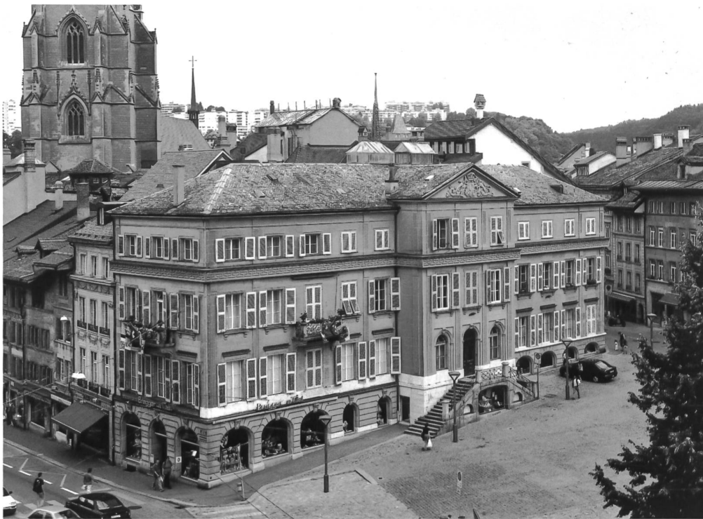
Fig. 1 La maison d'Alt sur la place de l'Hôtel-de-Ville à Fribourg.

Très peu de ces décors de papier peint sont parvenus jusqu'à nous, ce qui fait tout l'intérêt de celui qui est conservé dans la maison d'Alt à Fribourg 3 . En effet, les papiers peints sont par nature éphémères, plus particulièrement encore en milieu urbain, où les maisons, habitées en principe toute l'année, souffrent plus souvent de changement de décor que les résidences campagnardes estivales. Si l'ancienne salle à manger et le petit salon n'existent plus, suite à d'importantes transformations intervenues dans l'immeuble, en revanche le grand salon d'apparat ouvrant sur la place de l'Hôtel-de-Ville à l'étage noble est encore conservé dans son état d'origine, avec une bonne partie de ses aménagements néoclassiques et son décor mural quasiment intact.