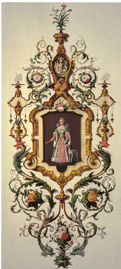
Fig. 6 Détail du panneau principal représentant Diane de Poitiers.

la bordure sont découpés indépendamment du fond pour être adaptés aux différents besoins, et placés au meilleur endroit.