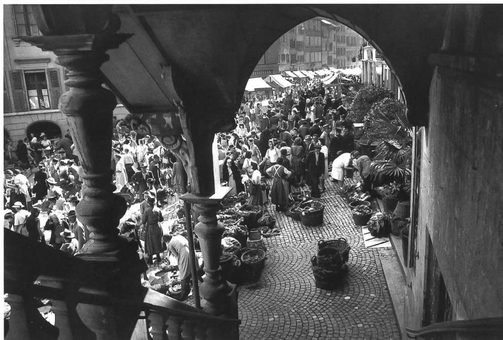
Fig. 113 Le marché de la place de l'Hôtel-de-Ville dans les années 1950.

FRÜH = Margrit FRÜH, Winterthurer Kachelöfen für Rathäuser, in: Keramik-Freunde der Schweiz, Mitteilungsblatt 95(1981), 3-147.