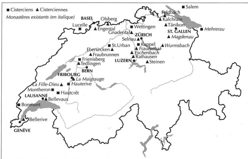
Fig. 130 Les cisterciens en Suisse.

Catherine WAEBER, L'abbaye cistercienne d'Hauterive FR (Guide de monuments suisses n° 469/470), Berne 1990.