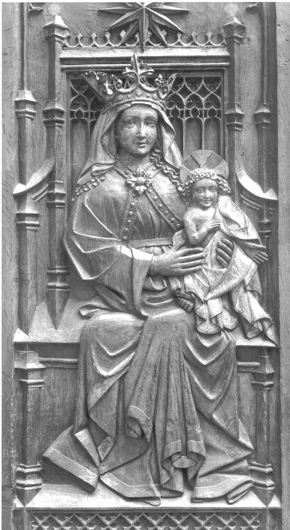
Vierge à l'Enfant, représentée sur un dorsal des stalles d'Hauterive exécutées entre 1472 et 1488. – La Vierge Marie est la patronne d'Hauterive, comme de toutes les abbayes cisterciennes.