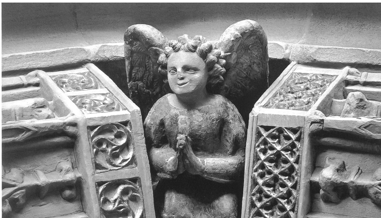
Fig. 94 Angelot en prière, entre les derniers dais de la troisième voussure.