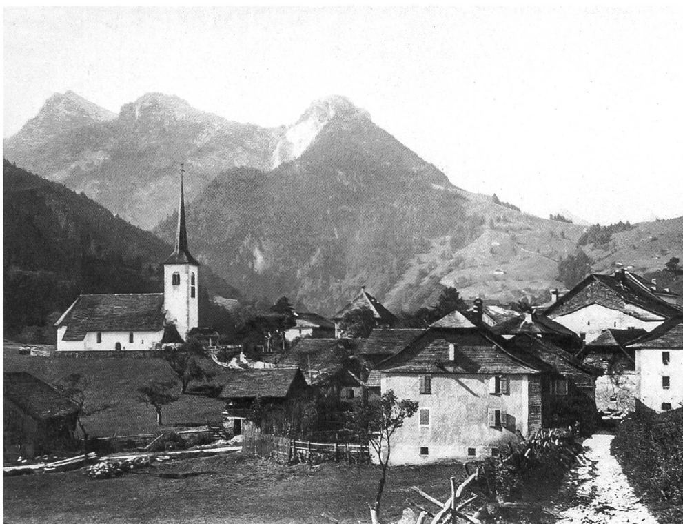
Le village de Montbovon en 1896, avec l'ancienne église construite entre 1618 et 1621.