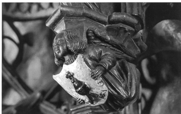
Fig. 105 Ange portant les armes du clergé, au dais des sièges de célébrants, 1515.