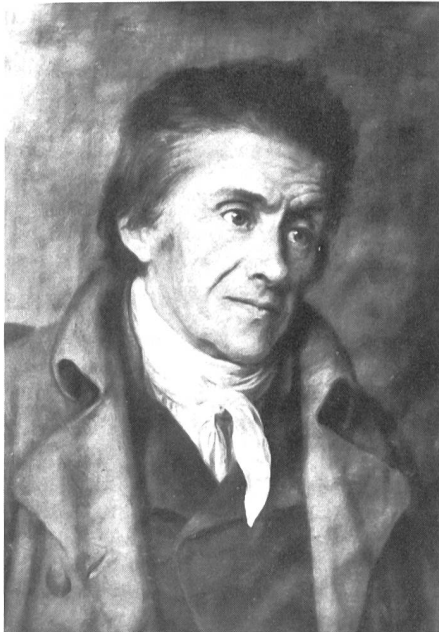
Ölgemälde von F. X. Ramos

Etude sur l'évolution de la pensée et de l'action du pédagogue suisse (1746–1827), 671 S. Publications Universitaires Européennes, vol. 105, Edition Peter Lang, Bern 1981