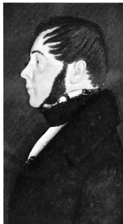
Gottlieb Pestalozzi, Enkel (1798–1863)