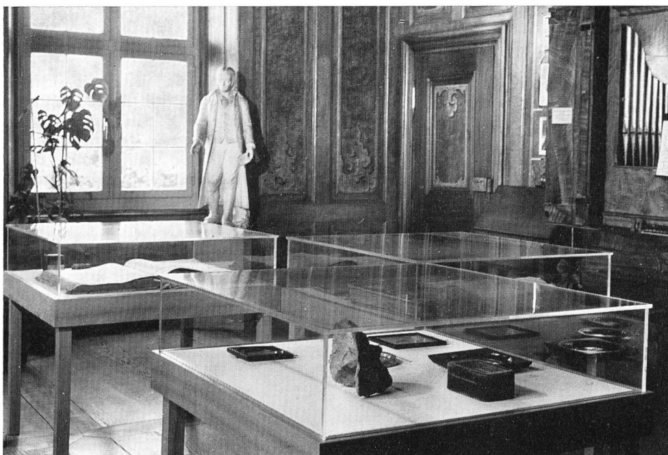
Teilansicht eines der drei Pestalozzi-Zimmer