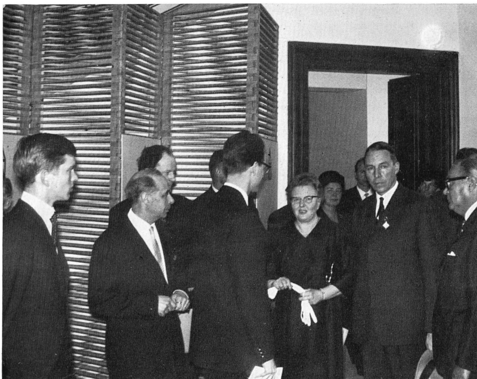
Eröffnung der Ausstellung «Die Schule in Finnland»

Hauswirtschafts- und Arbeitslehrerinnen überprüften die Bücher ihrer Fachgebiete. Eine grosse Zahl alter Bände konnte ausgeschieden werden; für Neuanschaffungen musste bei der Erziehungsdirektion ein Sonderkredit eingeholt werden. Die Arbeiten am Katalog über Hauswirtschaft und Handarbeit sind so weit gefördert worden, dass im laufenden Jahr eine Druckvorlage erstellt werden kann.