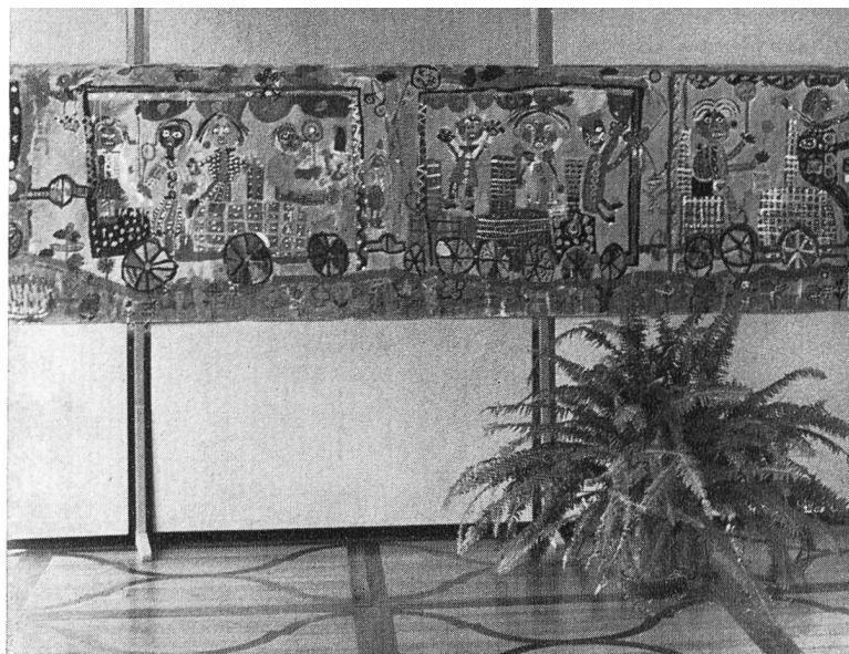
Ausstellung «Offene Malkurse der Stadt Wien»

Sämtliche Veranstaltungen waren sehr gut besucht. Wir sprechen der Stipendiatsstiftung der Schweiz. Vereinigung der Freunde Finnlands unseren herzlichen Dank für den namhaften finanziellen Beitrag aus, der es ermöglichte, dass Frl. P. Vilppunen sich drei Monate lang in Zürich aufhalten konnte. Sie erteilte an zwei Volksschulklassen den Turnunterricht und stellte ihre Dienste dem Kantonalen Fraueturnverband, dem Lehrerinnenturnverein und dem Akademischen Sportverband mit Freude und Hingabe zur Verfügung. Fer-