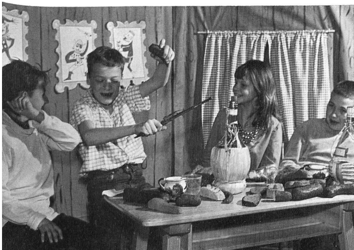
Eröffnung der Jugendbuchausstellung Eine Primarklasse spielt die «Bremer Stadtmusikanten»

Das von der erziehungsrätlichen Kommission verfasste Reglement über die Sonderklassen und die Sonderschulung im Kanton Zürich wurde im Verlaufe des Berichtsjahres den freien Lehrerorganisationen, dem