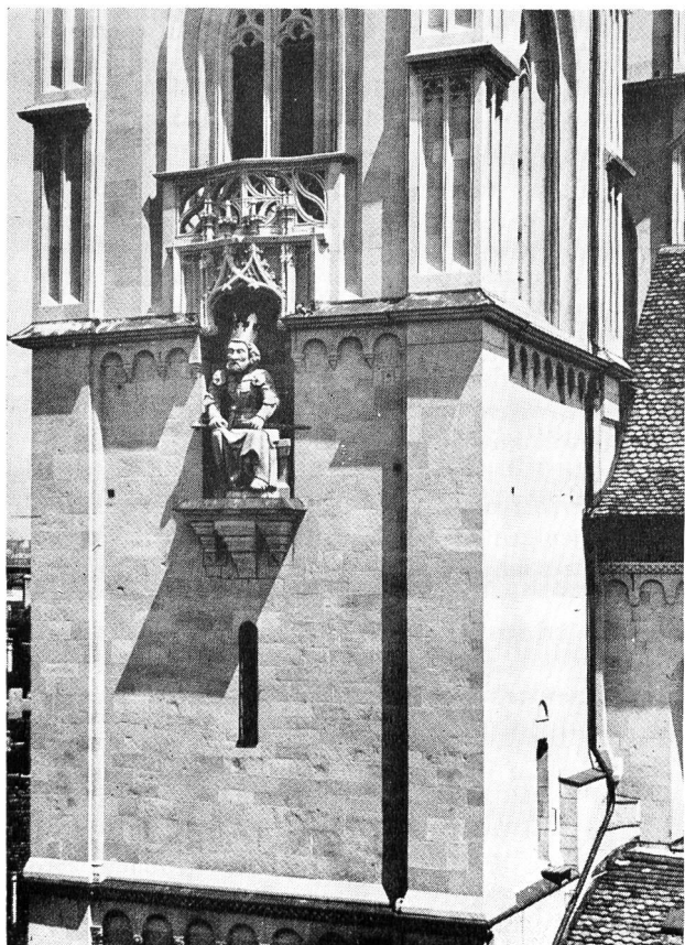
Aus «Drei Führungen durch die Zürcher Altstadt»

Im Verlaufe des Sommers wurden 8 Wanderungen organisiert, die Gelegenheit boten, das Geschaute in Wirklichkeit kennenzulernen und gleichzeitig als Vorbereitung für heimatkundliche Wanderungen mit der eigenen Klasse dienen. Es wurden hierbei dieselben Routen, wie sie in der Ausstellung besprochen waren, gewählt; allerdings mussten diese etwas gekürzt werden, da für die einzelnen Programme nur halbe Tage zur Verfügung standen.