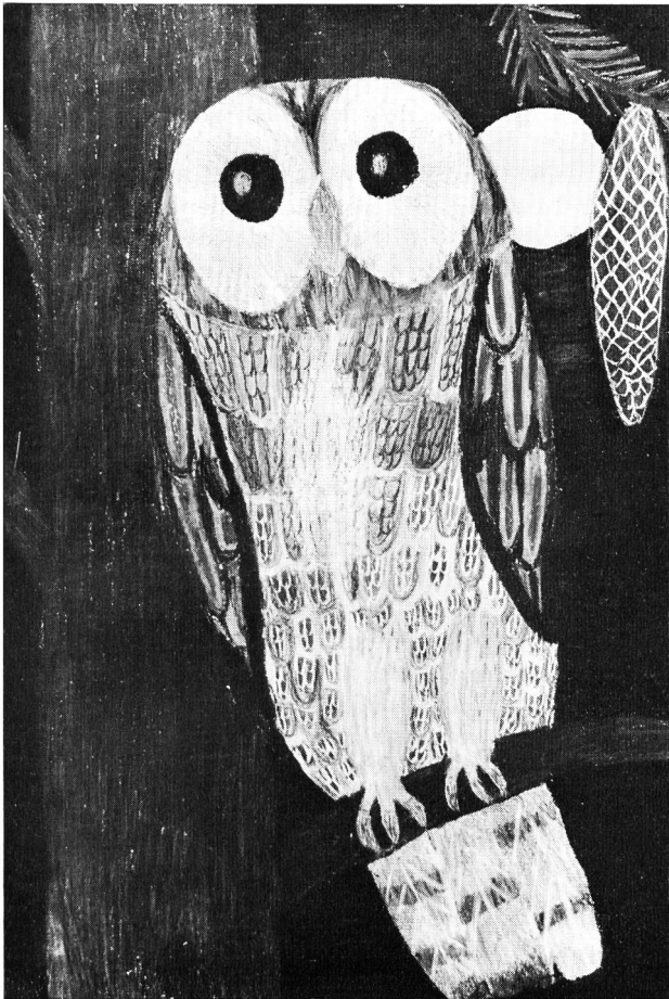
«Hella» in der Jugendbuchausstellung (Zeichnung 5. Klasse L. Linder)