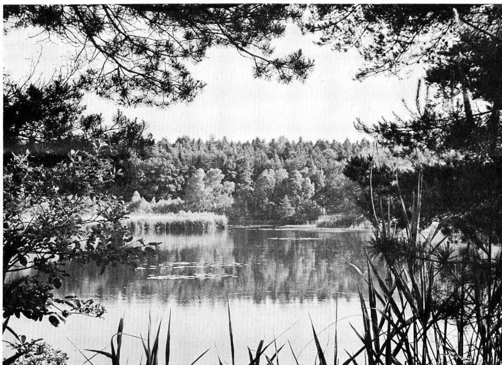
Husemer See. Ausstellung «Heimatkundliche Wanderungen im Kanton Zürich»