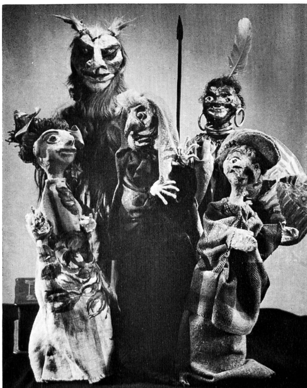
Ausstellung «Musische Erziehung auf der Unterstufe»

Das Pestalozzianum dankt allen Mitarbeitern für die vorzüglichen Veranstaltungen, die in weiten Kreisen der Lehrerschaft Anerkennung und Beifall fanden.