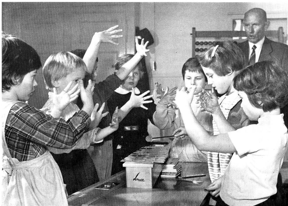
Musische Erziehung auf der Unterstufe

Dank dem grossen Angebot an Kleindias konnte die Sammlung des Pestalozzianums in einem erfreulichen Masse ausgebaut werden. Zu den bereits vorhandenen 220 Kleinbildserien wurden weitere 280 angeschafft, so dass nun für die Schulen und andere Interessenten eine reichhaltige Auswahl zur Benützung bereitsteht. Ein Neudruck des erweiterten Kleinbildkataloges kann nächstens herausgegeben werden. Besonders zu erwähnen sind die Farbphotos von Kunstwerken aus dem Louvre und dem Reichsmuseum in Amsterdam. Sie wurden von