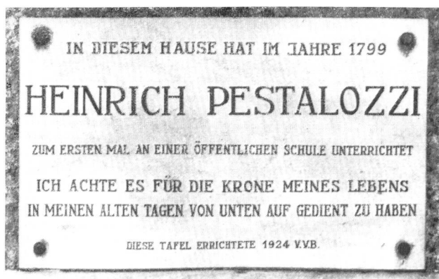
Erinnerungstafel am Haus Nr. 7, Kornhausgasse, ehemalige Hintersässenschule

Es war Pestalozzis eigener Wunsch, nicht sogleich als Theoretiker an einem Seminar zu wirken, vielmehr seine Methoden zunächst als praktischer Lehrer zu erproben. So finden wir ihn nun zunächst an der sogenannten Hintersässen-Schule an der Kornhausgasse (Haus Nr. 7).