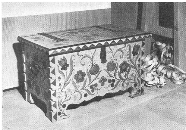
Zur Ausstellung «Der werktätige Lehrer»

Besonderer Dank gebührt den Kommissionen , die im Dienste des Pestalozzianums eine oft anspruchsvolle Arbeit zu bewältigen haben. Das gilt vor allem von der Bibliothekskommission , die aus den zahlreichen Ansichtssendungen das für uns Notwendige und Wertvolle auszuwählen hat, aber auch in eigener Initiative auf Neuerscheinungen aufmerksam macht. Ein «Wunschbuch» ermöglicht es den Besuchern unseres Instituts, ihrerseits Vorschläge für Neuanschaffungen zu machen. — Im Berichtsjahr hat eine besondere Studienkommission sich der Publikationen und Bilder zum Unterricht in biblischer Geschichte angenommen.