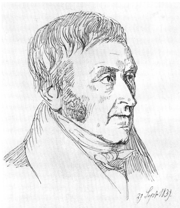
Christian Ludvig Ström (1771—1859) Lehrer am Blaaugård-Lehrerseminar, besuchte Pestalozzi in Burgdorf 1803

grosse Neubauten statt, und im folgenden Jahr wurde in Lenzburg eine Filiale errichtet. Gegen Ende des Jahrhunderts soll die Fabrik bis 120 Drucktische besessen haben. Pestalozzi hat (soweit ersichtlich) in den Jahren 1784—1802 auf dem Neuhof für die Wildegger Firma arbeiten lassen. Neben Hauspersonal, Malermeister, Stückträger und Farbholer, verwendete er dafür Kinder der Umgebung, die zu Hause wohnten. Welche Teile der Fabrikation als Hausarbeit besorgt wurden (Appretur), ist nicht genau ersichtlich. Jedenfalls arbeiteten die Angestellten sowohl mit Drucktischen als mit Handmalerei; im August 1784 scheint der Anfang gemacht worden zu sein.» (3. Band, Seite 482).