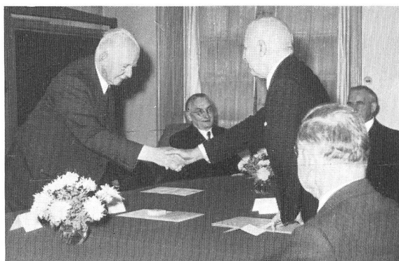
Prof. Ed. Spranger

seinem Quästorat erfolgte der Umzug des Instituts nach dem Beckenhof mit der Übernahme der neuen, grossen finanziellen Verpflichtungen; es kam der Anschluss unseres Personals an die städtische Versicherungskasse zustande; der Neubau mit neutralen Ausstellungsräumen brachte neue Belastung. Es galt dauernd, die Mittel, die dem Pestalozzianum zur Verfügung standen, höchst sorgfältig zu verwalten: die zunehmende Teuerung hat die Aufgabe nicht leichter werden lassen.