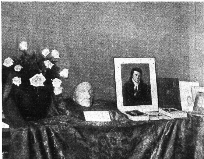
Aus einer Pestalozzi-Ausstellung in Lissabon.