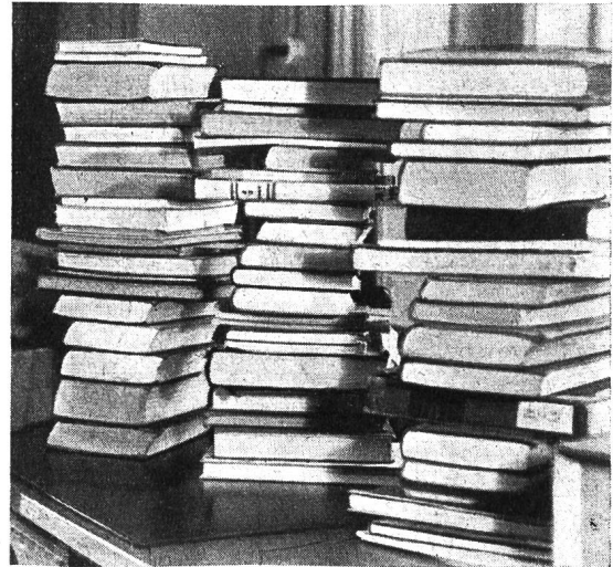
Zum Beginn des Tagewerkes im Pestalozzianum: Ausleihsendungen werden bereit gelegt.

Sicherlich liegt die Pflege solch internationaler Beziehungen im Interesse des Schweizervolkes. Dafür aber sollte der Bund die nötigen Mittel bereitstellen, statt die letzte kleine Subvention zu streichen. Es wäre im höchsten Grade bedauerlich und ein Unglück für unser Land, wenn im Bundeshaus nur noch die Machtansprüche der grossen Wirtschaftsverbände Beachtung finden würden, während stille Bildungsarbeit ohne jegliche Hilfe bleiben müsste.