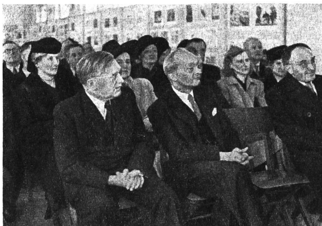
Eröffnung der Ausstellung «Neues Leben in den tschechoslowakischen Schulen».

Es zeigt sich bei solchen Ausstellungen immer wieder, dass sie besonderen Zuspruch finden, wenn sie nicht nur durch Führungen erläutert, sondern durch Vorträge, Lehrproben und Filme ergänzt werden. Im