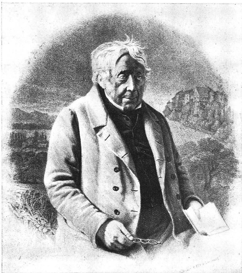
Christian Lippe (1779–1853)

Bei solch verschieden gearteten Charakteren war auf die Dauer kein erspriessliches Zusammenarbeiten