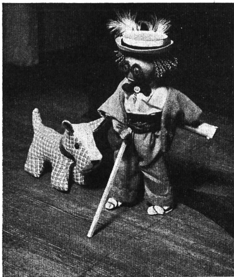
Selbstgemachtes Spielzeug. Stoffpuppen und -Tiere.