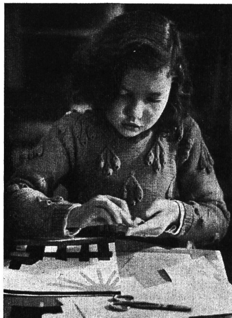
Selbstgemachtes Spielzeug. Kinder kleben ein Bilderbuch.

Nahmen so die äusseren Veranstaltungen einen erfreulichen Verlauf, so darf auch auf eine befriedigende Entwicklung der internen Tätigkeit hingewiesen werden. In Bibliothek und Lesezimmer zählten wir im ganzen 6168 Besucher (4610 aus der Stadt Zürich, 1217 aus dem übrigen Kanton und 341 aus andern Kantonen). Die Bibliothekskommission, die über die Anschaffungen für unsere Bücherei entscheidet, hat in sechs Sitzungen ihre Vorschläge bereinigt. Es sind 1017 Bände in unsere Bibliothek eingereiht worden — Doubletten nicht gerechnet — die, als grösste pädagogische Bibliothek unseres Landes, nunmehr etwa 75 000 Bände zählt.