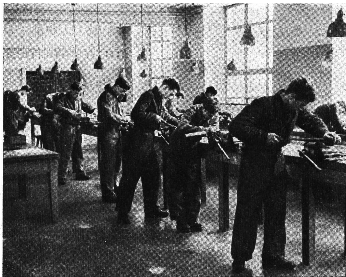
Werkjahr für Jugendliche. Kursteilnehmer an der Arbeit.